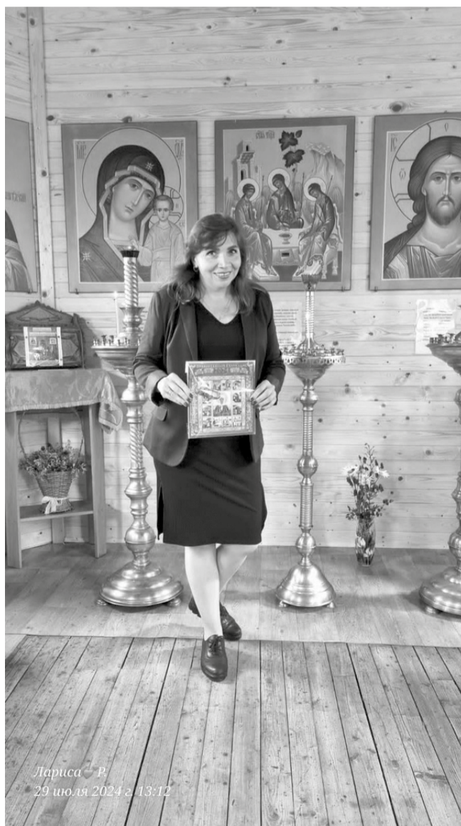
Лариса Р. 29 июля 2024 г. 13:12

Как и любое строительство, наше непременно ждет помощи физической на субботниках по вторникам в 17.00 и по сильной финансовой по размещенному Qr-коду. Помогайте, люди добрые! У нас уже столько сделано вместе с вами!!!