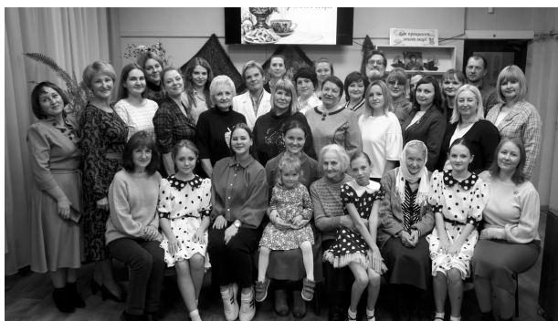
Церковная служба социальной помощи и благотворительности Нелидовского благочиния Ржевской епархии

Мы благодарим всех участников фотоконкурса за активность. Желаем дальнейших творческих побед и удачи! Выражаем признательность за совместную работу всех организаторов. Мероприятие украсили музыкальные и танцевальные номера фольклорного отделения Детской школы искусств, вокальной студии школы №5, девочек семейного клуба «Мастерская счастья» и «Мой семейный центр», а также праздничный каравай от кондитерской «Мэтр-кондитер».